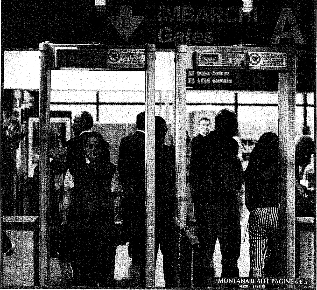
MONTANARI ALLE PAGINE 4 E 5