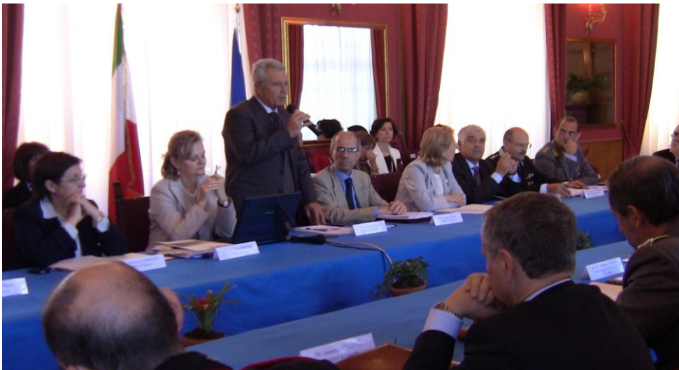
Conferenza Interprovinciale delle Autorità di Pubblica Sicurezza della Sicilia Orientale

Pertanto l'iniziativa sui Confidi è stata uno degli argomenti all'ordine del giorno della Conferenza interprovinciale delle autorità di pubblica sicurezza della Sicilia orientale, riunitasi il 13 maggio 2010 , alla presenza dei Prefetti delle Province di Catania, Enna, Messina, Siracusa e Ragusa, dei vertici delle Forze dell'ordine di ciascuna provincia, nonché del Comandante della Legione Carabinieri "Sicilia", del Comandante Regionale "Sicilia" della Guardia di Finanza e dei dirigenti della DIA di Catania, Messina e Caltanissetta.